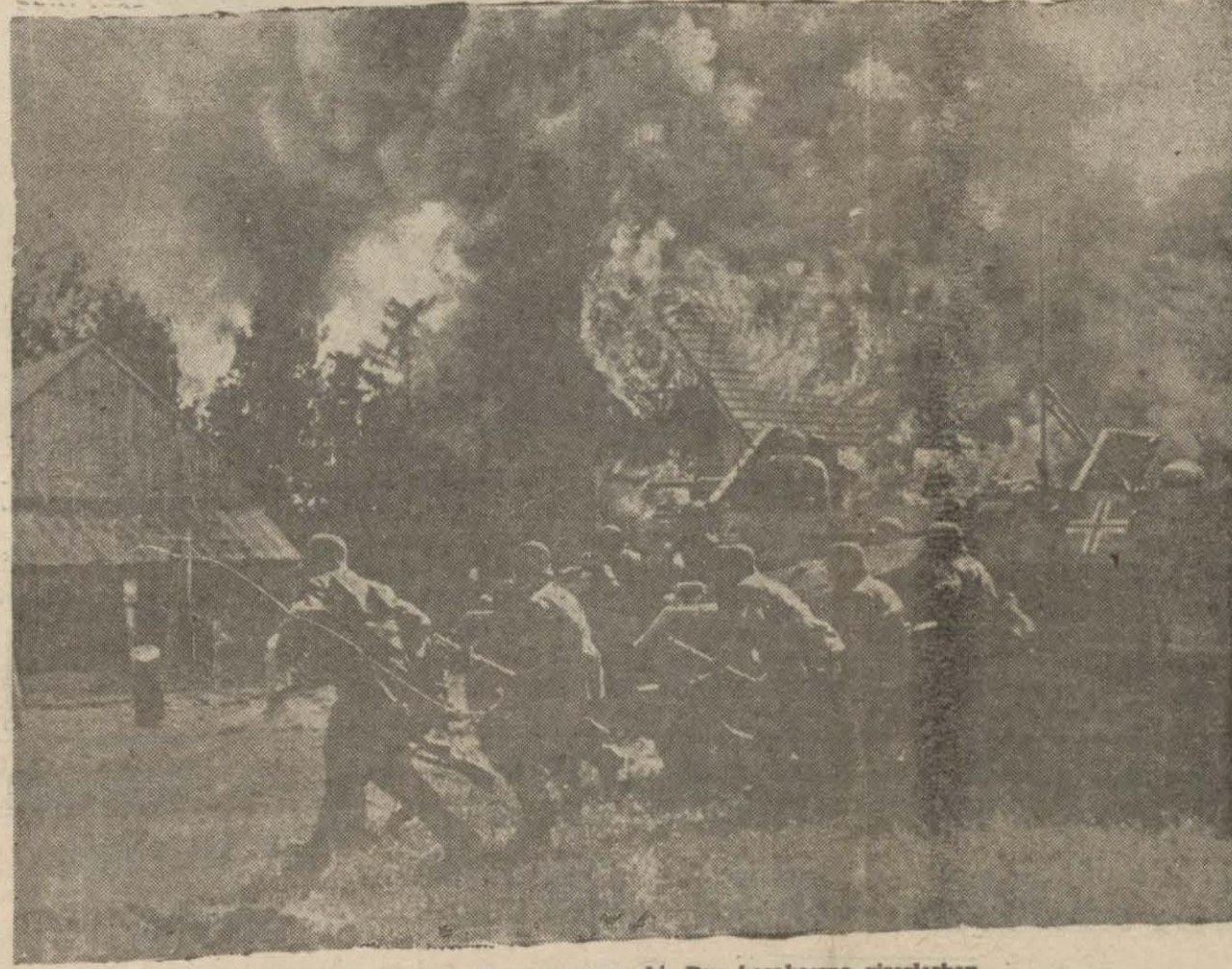
Alman motorlî kolları yanan bir Rus kasabasına girerlerken

Toprak Mahsulleri Ofisi de bu bakandan icab eden hazırlıklara başlamış bulunmaktadır.